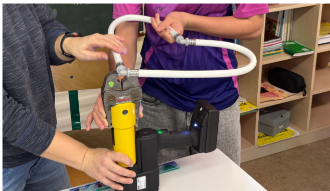
Rohre verpressen, Neukam Heizung und Sanitär

Nachdem auch der dritte Berufsinfotag erfolgreich war, soll er 2026 erneut stattfinden – wieder in Zusammenarbeit der beiden Mittelschulen, dann aber in Auerbach. Betriebe aus den FrankenPfalz-Kommunen, die Interesse haben sich zu beteiligen, sind eingeladen, sich an die Projektmanagerin der FrankenPfalz, Frau Frauenknecht, zu wenden (09643 3009090 oder info@frankenpfalz.de ).