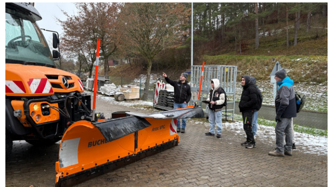
TecCheck mit dem Tablet der Seitz GmbH am Unimog der Autobahn GmbH

Zum Abschluss durften die SchülerInnen Feedback zu den Aktionen der Betriebe sowie allgemein zum Berufsinfotag geben. Hier zeigte sich erneut, dass ein solches Veranstaltungsformat bei den SchülerInnen gut ankommt.