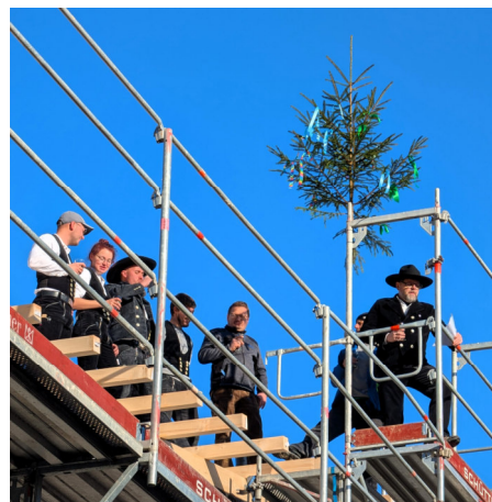
Richtspruch des Zimmerers in traditioneller Arbeitskluft