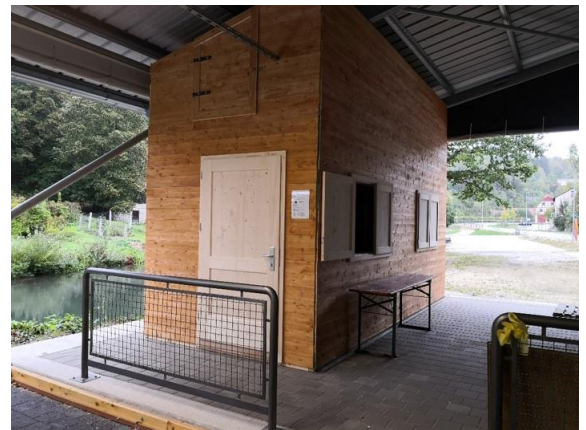
Die Versorgungshütte an der Stockbahn des TSV Velden e.V.; Foto: M. Taubmann

Durch das Regionalbudget der FrankenPfalz wird das Projekt „Versorgungshütte“ mit 10.000 € unterstützt. Die Nettogesamtkosten belaufen sich auf 12.739,59 €.