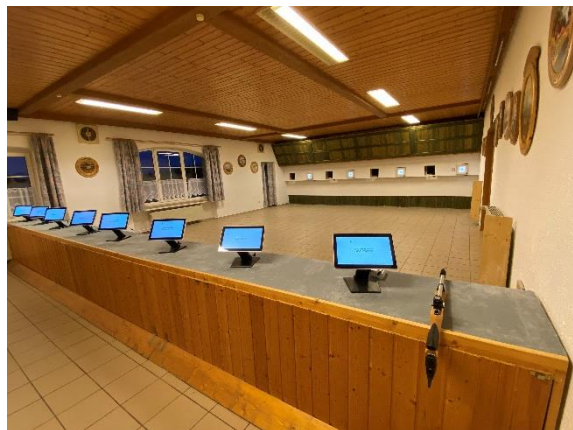
Die elektronischen Schießstände des SV Hufeisen-Weidensees e.V.

Im Schützenverein Weidensees finden sich vor allem die Weidenseeser Bürger zusammen. Der Verein ist aber auch offen für Interessierte und lädt regelmäßig zum Trainings- und Weihnachtsschießen ein. Außerdem finden vor Ort immer wieder überörtliche Veranstaltungen statt.